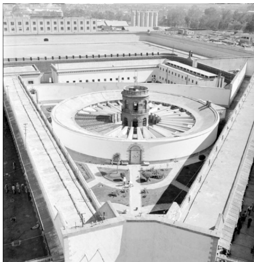
Figura 3. Vista aérea de una sección de Lecumberri.

Esta nueva prisión se construyó basada en un sistema radial, dispuso las secciones de los presos, a manera de que convergieran en un punto central que sirvió para la vigilancia de todo el inmueble. El torreón de vigilancia tuvo visibles todas y cada una de las crujías, además, contó con cocina, panadería, talleres y escuelas; también se incluyeron instalaciones para albergar al personal administrativo de la cárcel, habitaciones y oficinas. La Penitenciaría fue dividida en tres secciones para cubrir tres periodos de la vida carcelaria. La primera sección se ubicó en la parte más oculta del establecimiento, fue diseñada para 322 presos que en su primer periodo debieron estar sujetos a una incomunicación total las veinticuatro horas del día. El segundo periodo lo caracterizó el trabajo en común en los talleres y el aislamiento individual por las noches encaminado a la reflexión en sus celdas, esta sección estuvo destinada para 288 presos. El tercer periodo fue dedicado a lo presos más próximos a cumplir su condena o a obtener libertad preparatoria, esta sección se ubicó a un lado de la panadería y la cocina, tuvo una capacidad de albergar a 104 presos (Padilla Arroyo, 2001. pág. 267 – 269). En lo íntimo, las celdas eran de 3 metros con 70 centímetros de largo por 2 metros y 10 centímetros de altura, cada celda con excusado y lavabo.