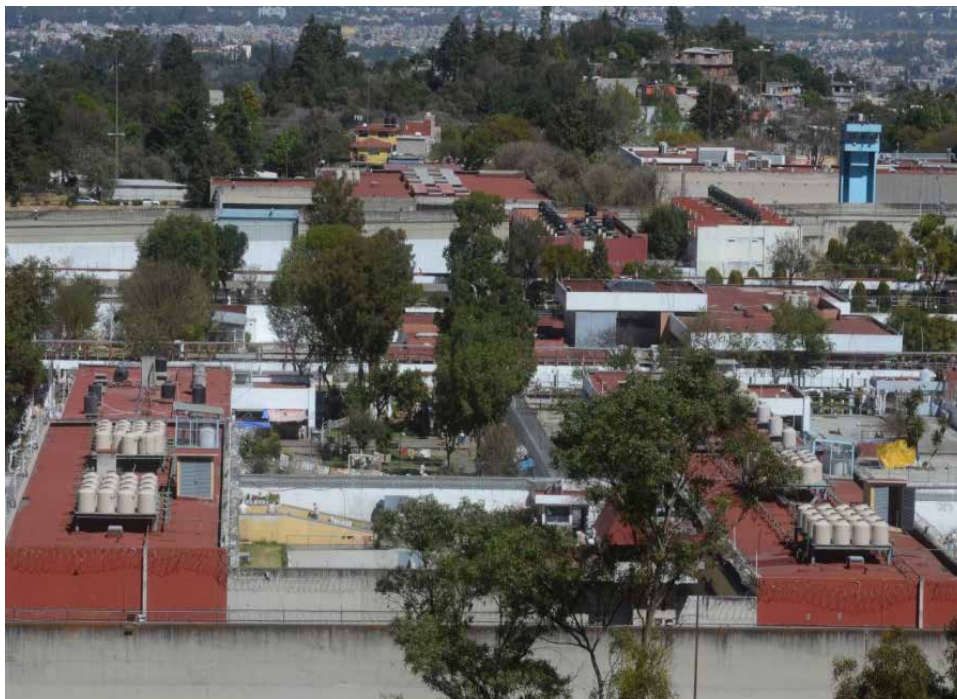
Figura 4. Vista aérea del Reclusorio Norte.

dad se ubicaron los miradores de vigilancia, formados por cilindros de concreto armado como base y la cabina tenía la forma de un cono truncado invertido, cuya altura era de 9.7 metros. Cada mirador tenía un rango de observación de 360° lo que permitía tener visión hacia el exterior del recinto.